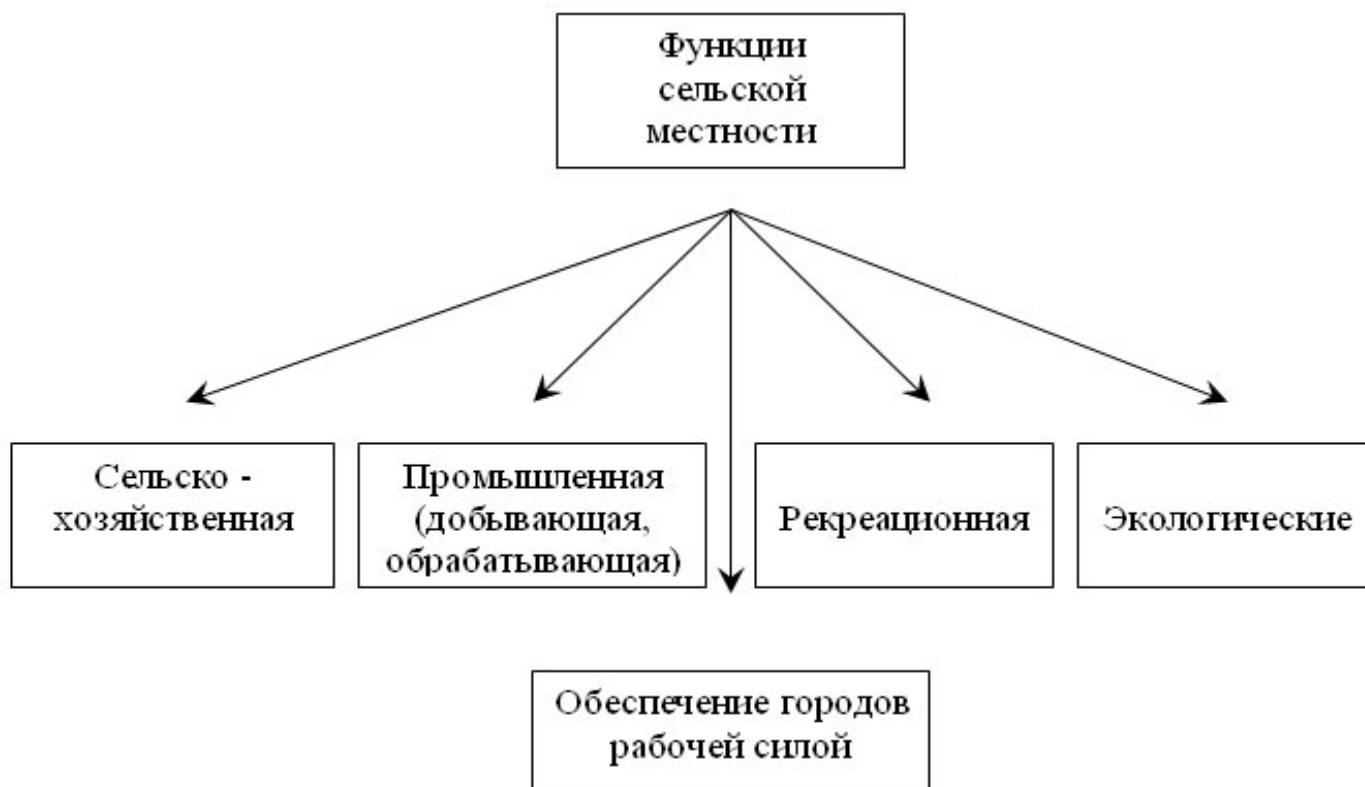
Рис.2. Функции сельской местности.

От того какая отрасль народного хозяйства развита в определенной местности будут зависеть функции, выполняемые этой местностью. Существуют несколько различных взглядов на функции сельской местности. Функции (роль, назначение) любого объекта зависят от того, в какой системе его рассматривать. Один и тот же сельский район или населённый пункт с точки зрения народного хозяйства страны служит центром производства сельскохозяйственной продукции, с точки зрения городских жителей этого района - местом отдыха, а с точки зрения самого сельского населения - средой жизнедеятельности. А поскольку систем отсчёта может быть множество, постольку сельская местность "многолика". Мы рассмотрим лишь "внешние" функции сельской местности - по отношению к городам и обществу в целом (рис.2).